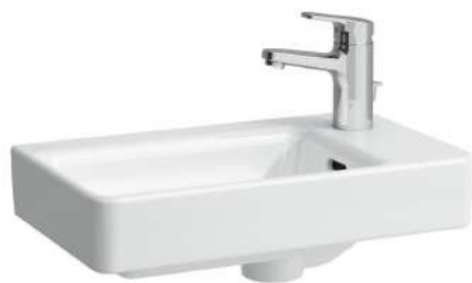
Umývatko, asymetrické pravé 480 x 280 x 85 mm