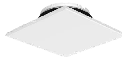
Odvodní hranatý ventil