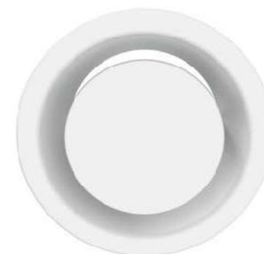
Odvodní talířový ventil