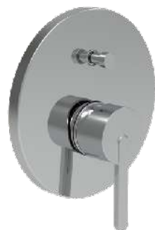
LAUFEN LUA podomítková páková vanová/ sprchová baterie