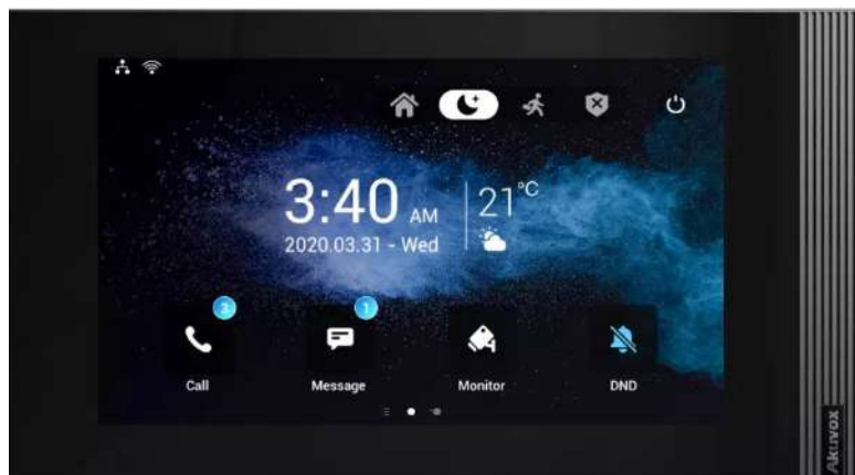
AKUVOX Tablet S563 8"