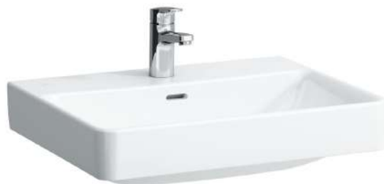
Umyvadlo 600 x 465 mm