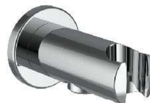
Připojení sprchové hadice 1/2" s držákem ruční sprchy