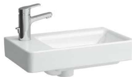
Umývatko, asymetrické levé 480 x 280 x 85 mm