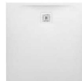
Sprchová vanička Laufen